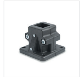
2 Kennziffer 2 mit 2 Edelstahl-Zylinderschrauben DIN 912