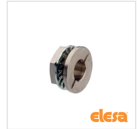
ELESA original design: GG-VCK